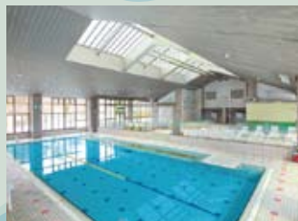
一年中利用できる温水プールで全身運動を！

自然豊かな秋田市近郊の河辺雄和地区には天然温泉の温浴施設や宿泊施設が点在。静養と健康づくりに！