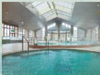
バーテゾーンでは全身浴や圧注浴、寝湯など各種の温浴スタイルを楽しめる。