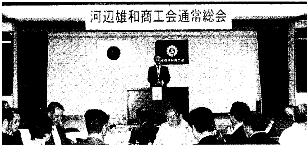
河辺雄和商工会通常総会