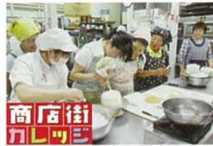
北秋田市「商店街カレッジ」事業

地域の「総合経済団体」として、また中小企業の支援団体として、豊かな地域づくりと商工業振興のために、意見活動、まちづくり活動、社会一般の福祉の増進など、幅広い活動を行っています。