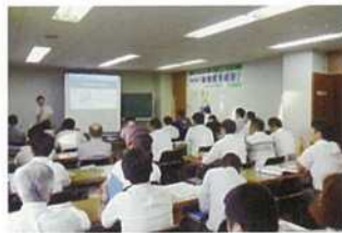
事業承継のための後継者育成塾