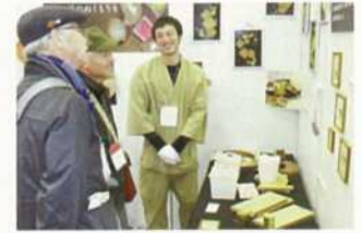
物産展・商談会への出展