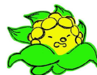
秋田県中小企業 応援キャラクター 「がんばっけさん」

秋田県 産業労働部 産業政策課デジタルイノベーション戦略室 デジタルイノベーション戦略班 〒010-8572 秋田県秋田市山王三丁目1-1 県庁第2庁舎3階 TEL 018-860-2245 FAX 018-860-3887 MAIL digital@pref.akita.lg.jp