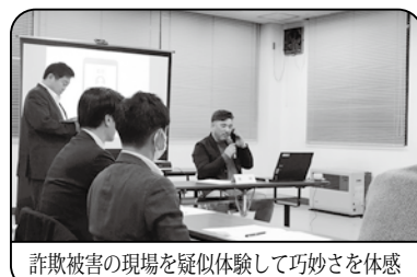
詐欺被害の現場を疑似体験して巧妙さを体感

毎日、新聞報道されている特殊詐欺ですが、講師は「手口が巧妙化しており、被害防止には“個人の防御力の強化”と“社会的防御力の強化”の両面から対策する必要がある。」と話されました。