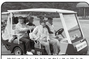
笑顔でラウンドされる参加者の皆さま

今回で6回目となる「商工会親睦ゴルフコンペ」を 11 月 3 日（文化の日）に開催しました。当日は会員や関係機関から総勢